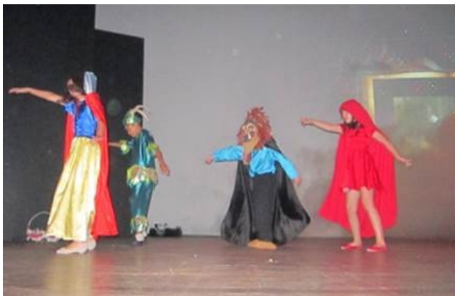
Apresentação no Palco