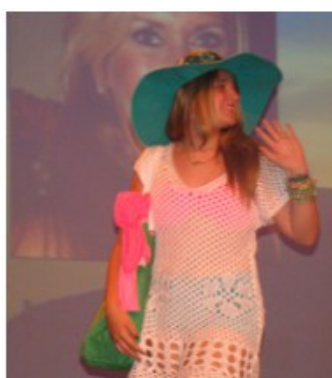
Rio de Janeiro: Cidade Maravilhosa Colégio Cotiguara de Presidente Prudente