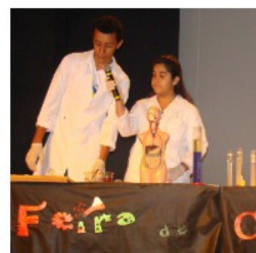
Feira de Ciências Agnes Rondon Ribeiro de Santa Fé do Sul