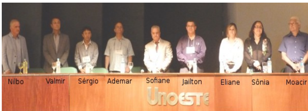
Mesa de Abertura do ENETEC 2013