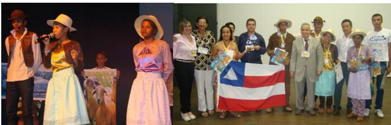
Apresentação no Palco