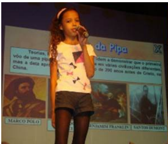
Apresentação no Palco