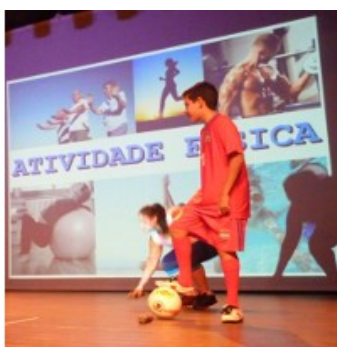
Atividade Física Prefeitura de Batatais