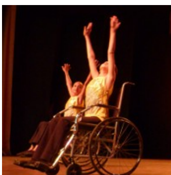
Educação Física Adaptada Inclusiva Prefeitura de Pirassununga