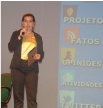
Redes Sociais Colégio Anglo de Dracena

O projeto “Células” do Colégio Municipal Bosque de Presidente Prudente foi desenvolvido utilizando exclusivamente o Tablet com Visual Class Android . Para conhecer mais sobre este projeto, acesse o blog: http://www.class.com.br/projetos/piloto .