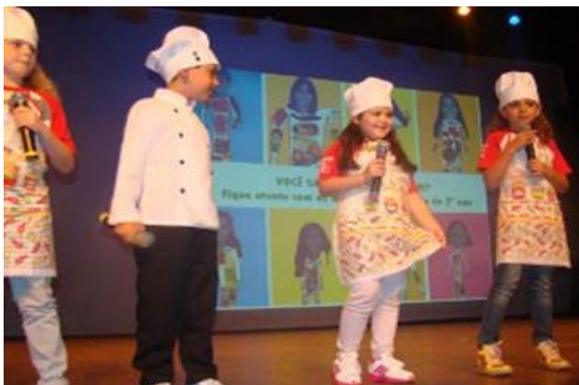
Apresentação no Palco