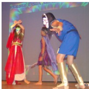
Grécia e Seus Mitos C.E.M José Inácio da Prefeitura de Araguari (MG)