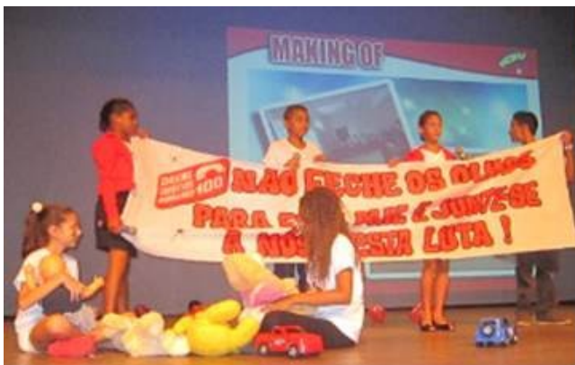
Apresentação no Palco