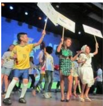
Brasil Meu Brasil Brasileiro Prefeitura de Presidente Prudente