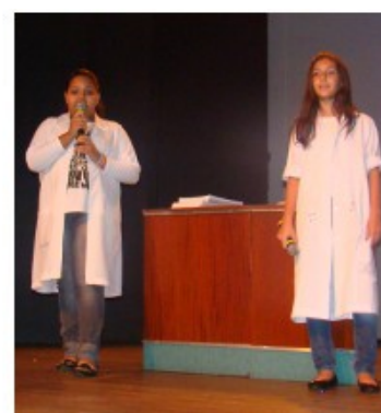
Células Colégio Municipal Bosque de Presidente Prudente