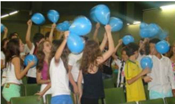
Torcida em Ação

Este ano a concorrência para o prêmio de Melhor Torcida esteve muito acirrada. Várias equipes trouxeram uma grande e animada comitiva: Anglo de Dracena, Prefeitura da Bahia, Prefeitura de Santa Fé do Sul, Prefeitura de Araguari e Colégio Cotiguara. A torcida vencedora foi o Colégio Anglo de Dracena, conquistando o bicampeonato.