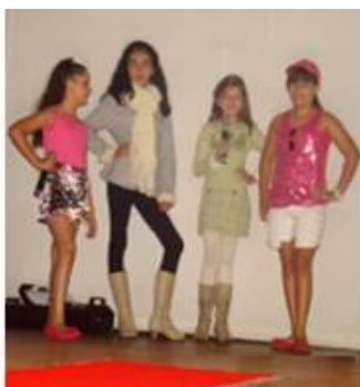
Moda Prefeitura de Dumont