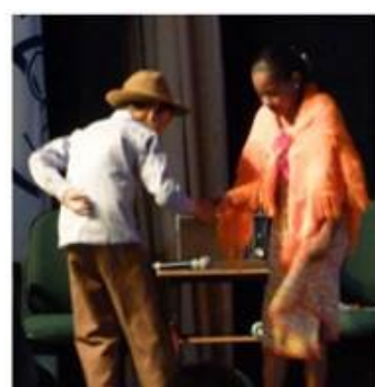
Aos Idosos com Carinho Prefeitura de Araguari (MG)