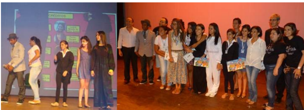
Apresentação no Palco